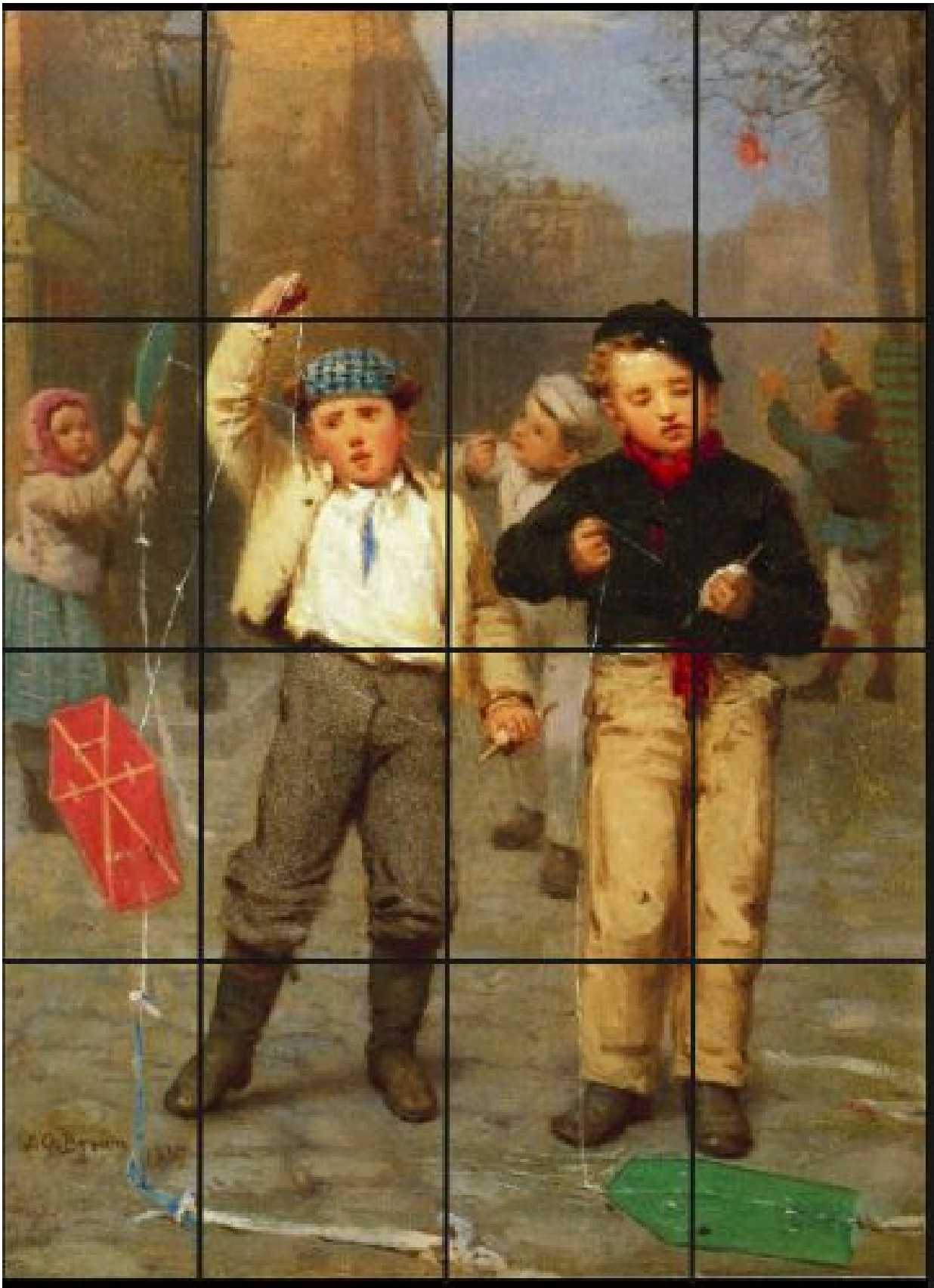
Fonte: BROWN, John George. Flying Kites (1867) . Disponível em: < http://www.the-athenaeum.org/art/detail.php?ID=31853 >. Acesso em: