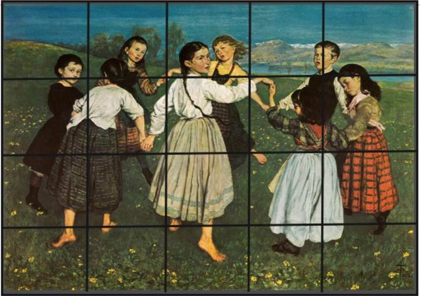
Fonte: THOMA, Hans. Der Kinderreigen (1872). Disponível em: < https://commons.wikimedia.org/wiki/File:Hans_Thoma_-_Der_Kinderreigen_(1872).jpg >. Acesso em: